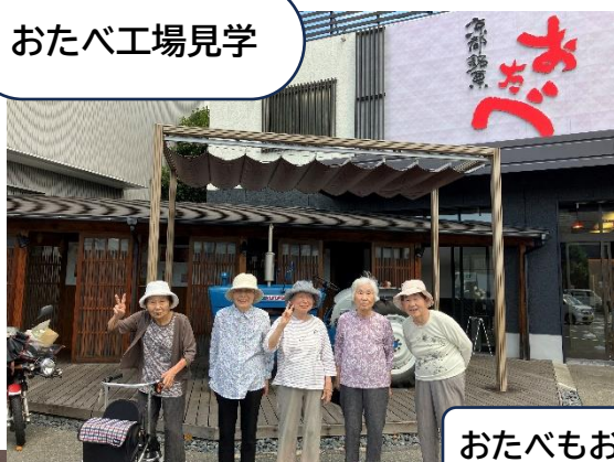
おたべもおいしく頂きました