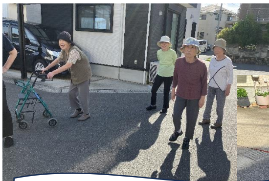
朝からお散歩…ご近所さんと挨拶