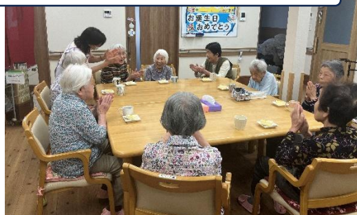
皆さんでお誕生日をお祝いました