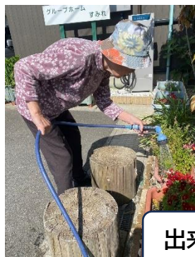
出来ること、を大切に