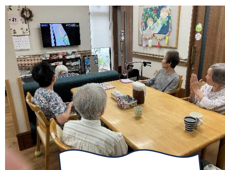
オリンピック観戦